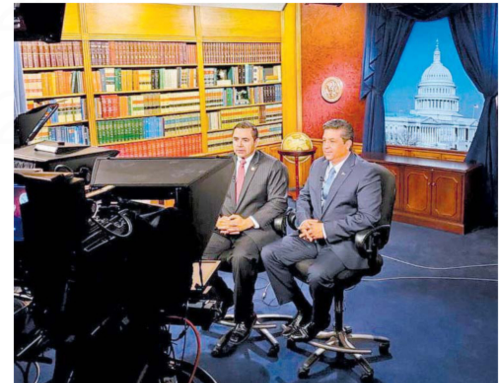
El gobernador Francisco García Cabeza de Vaca en gira de trabajo por Washington D.C.

"Queremos que las armas no lleguen a México y mucho menos a manos de criminales porque ellos generan la violencia en nuestro país", manifestó el Gobernador.