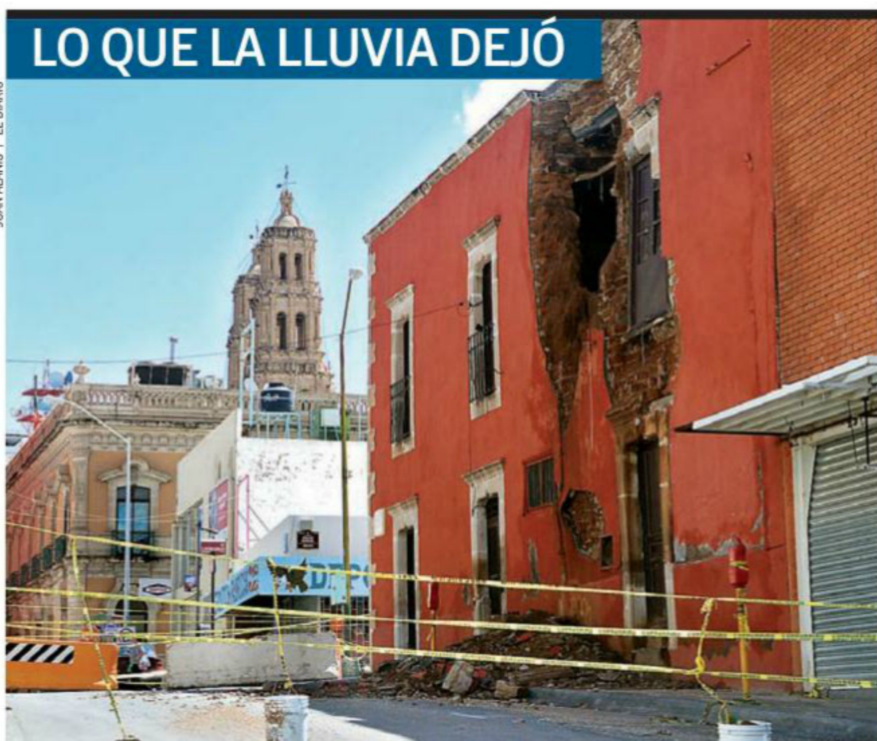
JUAN ALANÍS / EL DIARIO