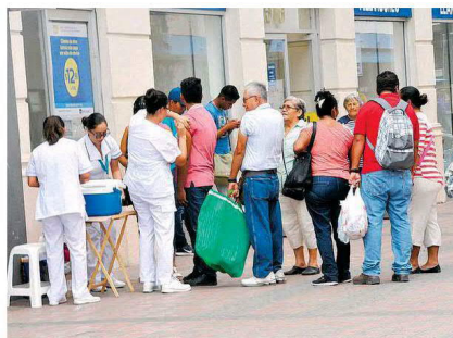
Largas filas de ciudadanos se observaron en los módulos de vacunación contra la influenza

De acuerdo con ello, las temperaturas por debajo de la media durante la temporada otoño-invierno en Tamaulipas